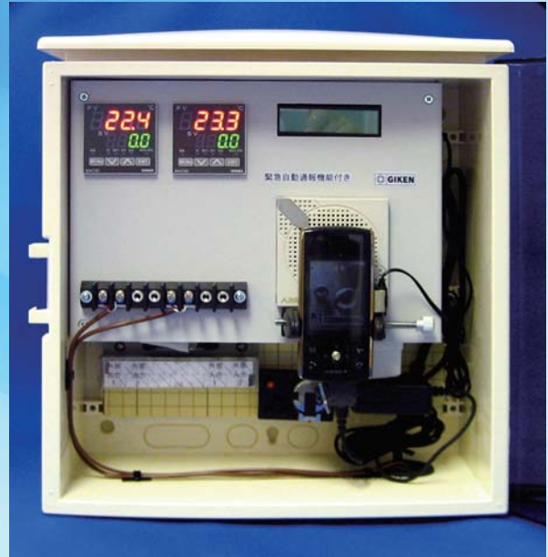
写真のタイプは温度測定箇所2箇所（2連式）タイプです。1連タイプもございます。

本器は、熱電対を利用して温度の監視・外部機器制御・警報発信（音声通報）にもご利用できます。